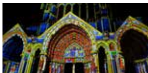
Rameaux Chartres 2017

http://rando-aventure-malaunay.blog4ever.com