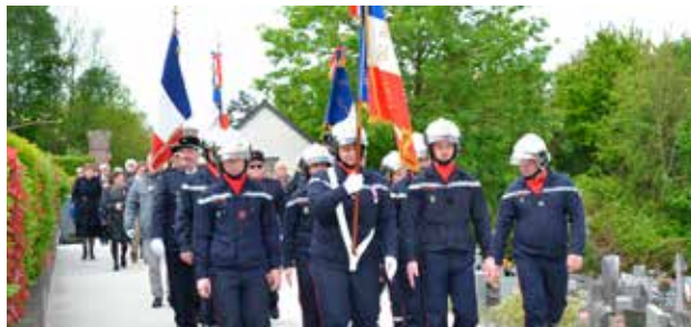
Exposition "Malaunay 39-45" en mai au Forum Boris Vian et cérémonie du 8 mai.