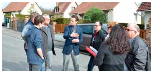
Visite de quartier à Frévaux en mars.