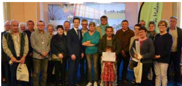
Félicitations aux médaillés du travail.