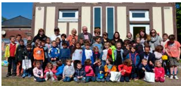
Chasse aux oeufs de Pâques au centre de loisirs d'avril.