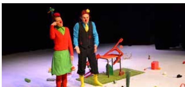
Spectacle burlesque du CLEAC