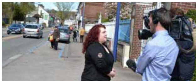
TF1 en tournage à Malaunay