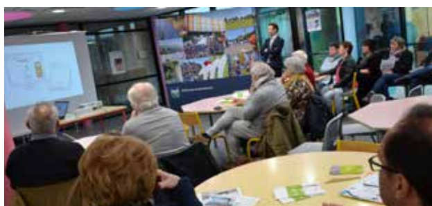
Réunion sur le financement participatif pour le solaire