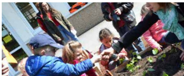
Plantation au jardin potager scolaire