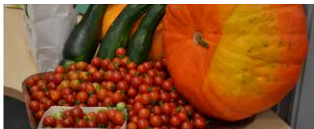
Récolte de légumes du potager de la Maternelle Miannay