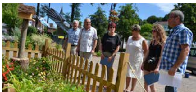
Passage du Jury départemental Villes et villages fleuris