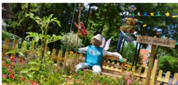
Décor d'été devant la mairie