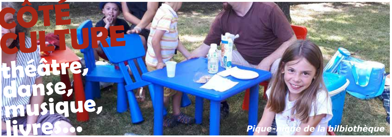
Pique-nique de la bibliothèque