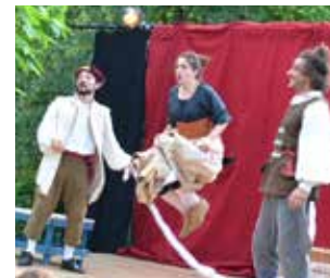
Commedia dell'arte le 7 juin dans les jardins de l'espace Pierre Néhout