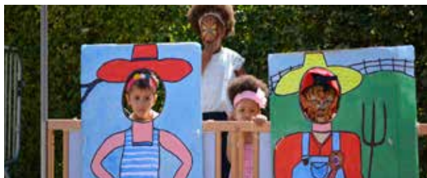
Fête de la crèche Ribambelle en juin