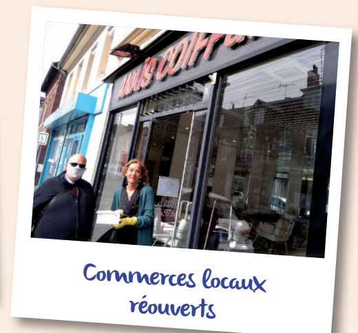
Commerces locaux réouverts