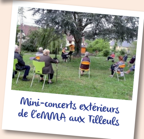
Mini-concerts extérieurs de l'EMMA aux Tilleuls