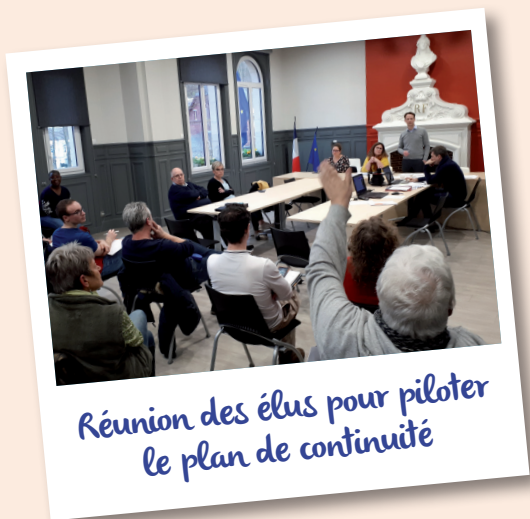
Réunion des élus pour piloter le plan de continuité