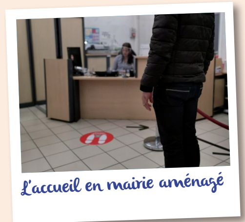
L'accueil en mairie aménagé