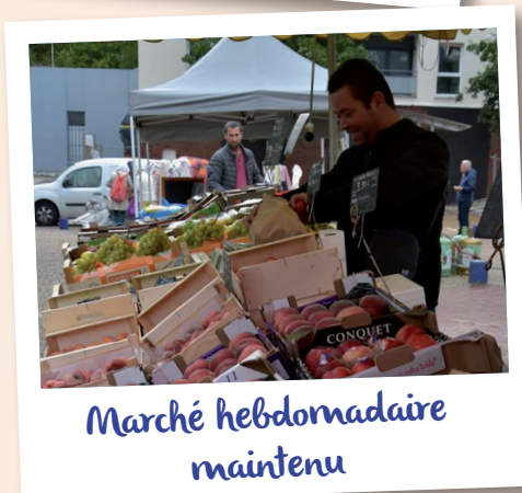
Marché hebdomadaire maintenu