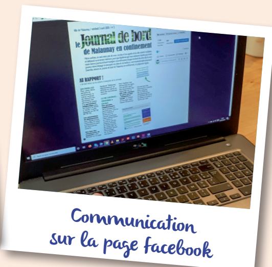
Communication sur la page facebook