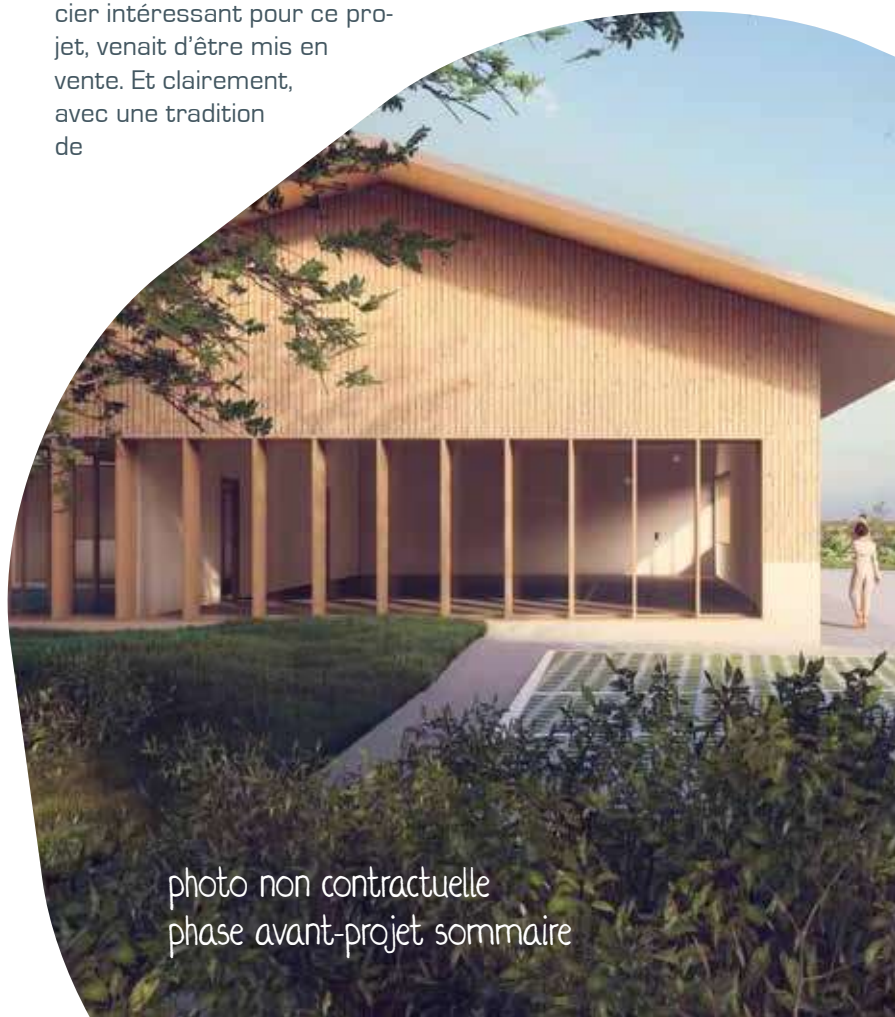
photo non contractuelle phase avant-projet sommaire

Intervention en rénovation couverture et façades avec performance énergétique améliorée Pose d'équipements techniques efficaces : chaufferie, VMC, SSI, vidéoprotection Création d'une salle de conférence modulable en espaces découpés pour la formation Aménagement de bureaux tertiaires Création remise de véhicules La MDSC en quelques dates 2024 : promesse de vente signée, puis validation du pro- gramme par le SDIS Février 2025 : consultation de maîtrise d'oeuvre été 2025 : choix En 2026 : travaux désamiantage et dépollution du site 2027 : livraison & inauguration des locaux