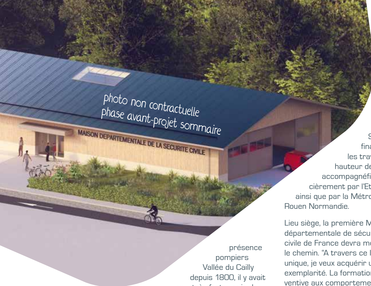
photo non contractuelle phase avant-projet sommaire

SDIS76 finance les travaux à hauteur de 2M€, accompagné finan- cièrement par l'Etat, ainsi que par la Métropole Rouen Normandie.